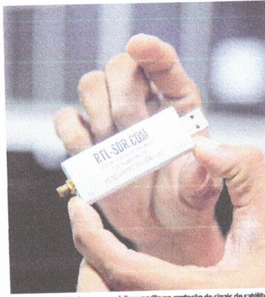
Dispositivo que funciona como rádio e antena na captação de sinais de satélite

Roteiro: Curso de Engenharia Aeroespacial da UFMA