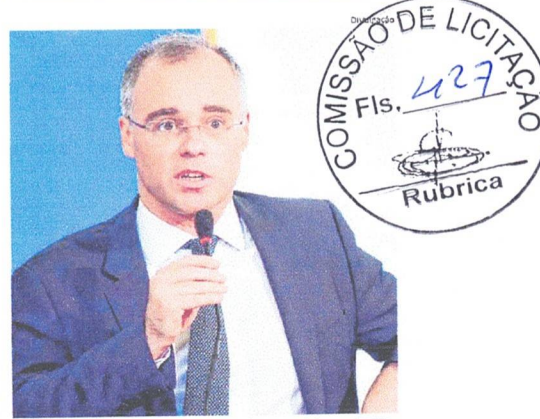
André Mendonça ainda não conseguiu os votos necessários no Senado

Em defesa de Bolsonaro, o líder do governo no Senado, Fernando Bezerra Coelho (MDB-PE), alegou que o chefe do Planalto recebeu o documento e levantou os questionamentos justamente porque o número de mortes está diretamente relacionado às regras para envio de recursos financeiros a Estados e municípios. ■