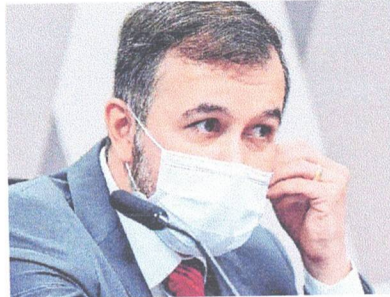
Alexandre Marques diz que dados foram repassados a Bolsonaro pelo pai

As alterações que o documento sofreu entre o conteúdo produzido pelo auditor e a divulgação do presidente. De acordo com o depoente, o documento foi compartilhado com auditores do TCU no dia 31 de maio e enviado ao pai em 6 de junho, um dia antes de Bolsonaro citar o relatório paralelo. Após a declaração de Bolsonaro, uma versão do documento circulou no formato PDF e com selo do TCU, características normalmente usadas em relatórios oficiais. O auditor, no entanto, afirmou que produziu o levantamento no formato Word e sem qualquer inscrição oficial do tribunal.