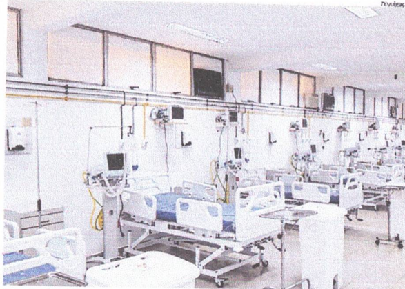
Somente o Hospital de Traumatologia e Ortopedia, em São Luís, será contemplado com 10 novos leitos

Três unidades de saúde que tratam pacientes com Covid-19 no Maranhão receberão os leitos com ventilador pulmonar. Uma delas é o Hospital Regional Dr.