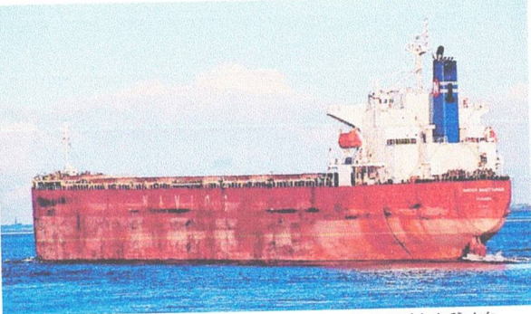
Navio MV Sagittarius continua sem autorização para atracar na área portuária de São Luís

T ripulante filipino que deu entrada em Unidade de Terapia Intensiva (UTI) de hospital particular de São Luís, no último dia 22 de agosto, depois de testar positivo para Covid-19, segue internado desde o dia 23. Nesta terça-feira (31), a Secretária de Estado da Saúde (SES) informou que mais quatro pessoas do navio MV Sagittarius testaram positivo para a doença. A pasta afirma que ainda não há resultado do sequenciamento genômico para identificar a variante do vírus em nenhum dos tripulantes. O caso segue sendo acompanhado pelo Centro de Informações Estratégicas de Vigilância em Saúde (CIEVS) e Superintendência de Vigilância Sanitária (Suvisa), em cooperação com a Anvisa.