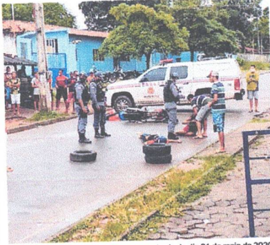
Dois adolescentes foram assassinados na tarde do dia 31 de maio de 2020

Em 2018, um total de 1.982 pessoas foram assassinadas por arma branca ou a tiros no Maranhão. Entre estes casos, 976 vítimas tinham 15 a 29 anos. No ano de 2017, houve o registro de 2.180 mortes violentas e 1.112 eram jovens. Os números ainda crescem nos anos anteriores. Em 2016, ocorreram 2.408 assassinatos e, entre essa quantidade, 1.212 vítimas tinham a idade entre 15 a 29 anos. No ano de 2015, foram 2.438