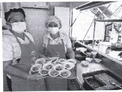
As nutricionistas do SESI realizarão diversas oficinas com alimentos do dia a dia na Feira do Empreendedor

Cadastro Nacional de Pessoa Jurídica (CNPJ) e, no ato, já são informados se estão enquadradas nas regras para adesão ao serviço. O SESI Facilita está integrado à plataforma SESI Viva+, de inteligência em gestão de saúde e segurança no trabalho.