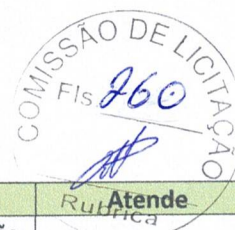
TABELA DE AVALIAÇÃO DA PLATAFORMA