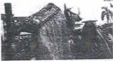
A tradicional Festa de São Marçal 2017, no João Paulo está montada

Programa de Fomento é lançado Entre as ações do Ministério da Educação, o MEC lançou o Programa de Fomento à Implementação de Escolas de Ensino Médio em Tempo Integral, com o objetivo de apoiar a implementação de escolas de Ensino Médio em Tempo Integral em todo o Brasil. O programa prevê o apoio financeiro para a implementação de escolas de Ensino Médio em Tempo Integral em todo o Brasil.